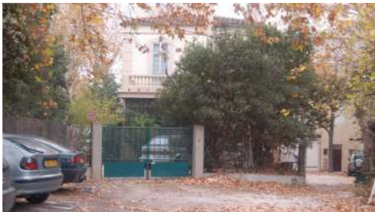
Photo des habitations qui vont être démolies pour la construction des nouvelles voies.

L'ouverture des quais de Genève SUITE A LA CONCERTATION ENTRE LA MAIRIE ET Les riverains va se faire uniquement par une voie pour les piétons et une voie cyclable. Celles-ci devraient par la suite longer la Basse et rejoindre la piste cyclable de l'avenue l'Abbé Pierre (côté Saint Assicle).