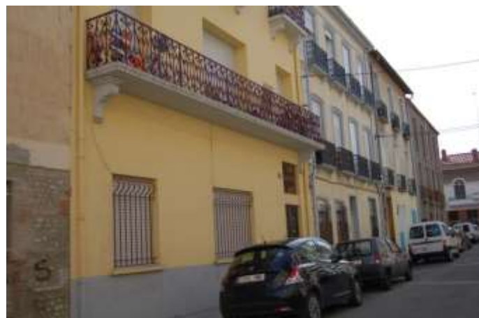
Rue du Progrès