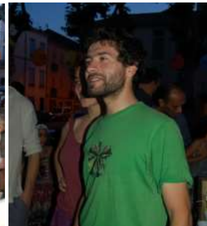
Le gagnant du Concours « Crachat de noyaux de cerise »