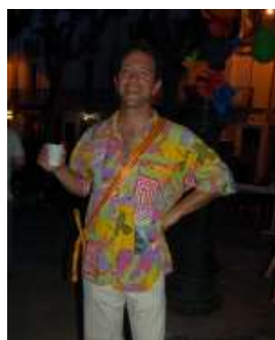
Mister Fête des Voisins