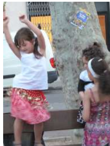
Une belle danseuse