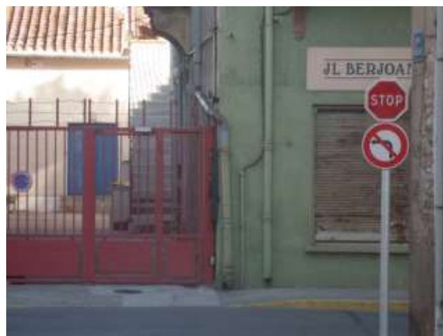
Rue Valette/ av. de Grande Bretagne