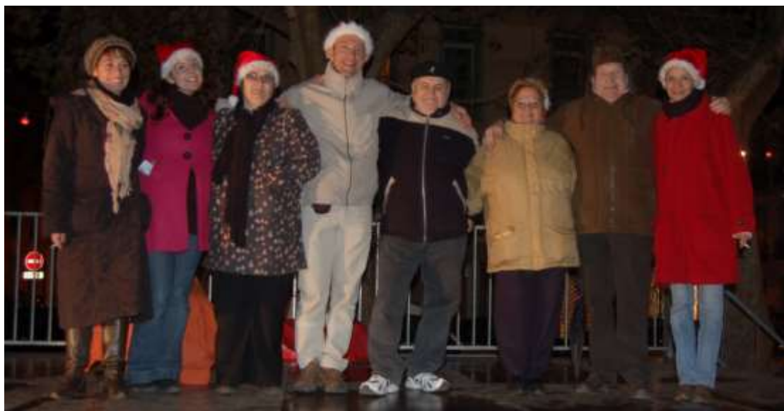
Une partie des organisateurs et bénévoles