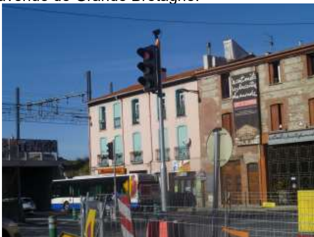
Carrefour Bd Conflent/ av. de Grande Bretagne

Mais depuis la réponse reçue, nous avons pu remarquer dernièrement qu'à nouveau le bout de la rue Valette n'était plus en sens interdit. Cela permet aux automobilistes de tourner à droite sur l'avenue de Grande Bretagne.