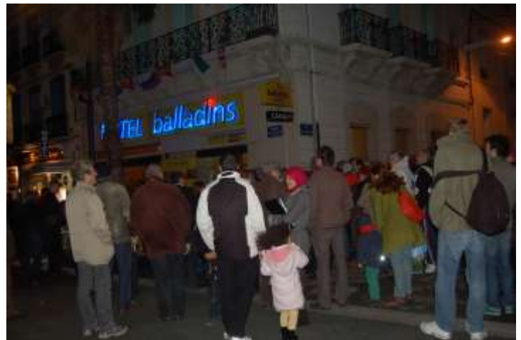
Manifestation de soutien à Sabit