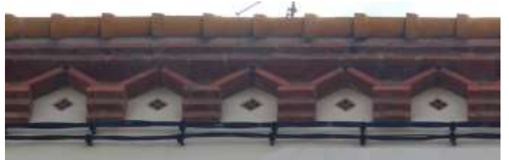
Exemples de génoises dessinées par Edouard Mas-Chancel, rue Gabriel Fauré