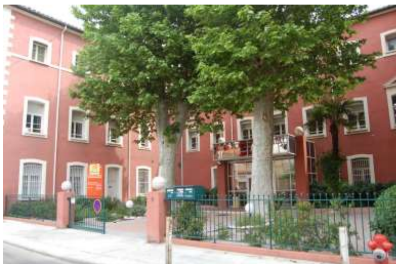
L'ancienne Ecole normale d'Institutrices

Egalement, en 1881, l'Ecole normale d'institutrices est inaugurée (il existait seulement à Perpignan une Ecole normale d'Instituteurs, place des Esplanades). Ce choix dans le quartier Gare s'est fait, grâce à la promiscuité des autres écoles communales (école d'application maternelle et primaire). Centenaire en 1981, l'Ecole normale d'Institutrices rendit de bons et loyaux services jusqu'en 1987. A cette date, le bâtiment est devenu propriété du Conseil Général des PO et abrite actuellement l'Office public de l'Habitat (Office 66).