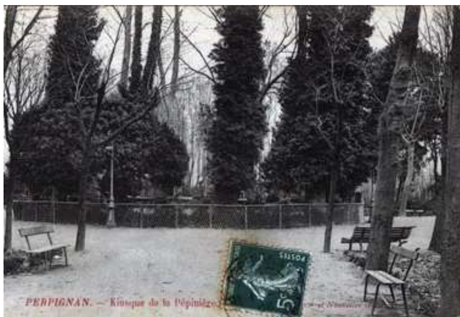
La Pépinière en.....